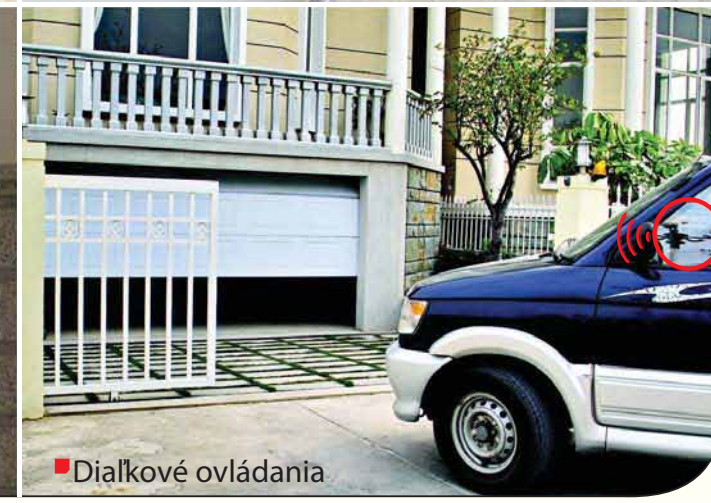
■ Diaľkové ovládania