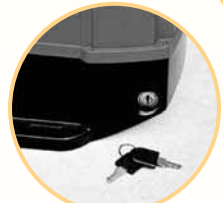
■ Núdzový vypínač