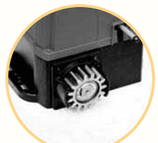
■ Ozubený pastorok

Inteligentný mikropočítač - zabudované inteligentné ovládanie s jediným tlačítkom pre ovládanie otvárania - zastavenia - zatvárania, s mechanickým vypínačom. Počítač včas registruje každý malý odpor a prekážku. V prípade zaznamenania prekážky sa pohyb dverí obráti. Motor na striedavý prúd (AC) - mimoriadne tichý chod, ochrana proti prehriatiu. Kódovaná ochrana - pomocou rolovacej kódovej technológie, s ochranou pred vlámaním. Núdzové zariadenie pre prípad výpadku elektrického prúdu - vedľa motora sa nachádza núdzový vypínač, ktorý v prípade výpadku prúdu umožňuje ručné ovládanie. Voliteľná funkcia - je k dispozícii PCB s fotobunkou ručným ovládaním a blikajúcou lampou.