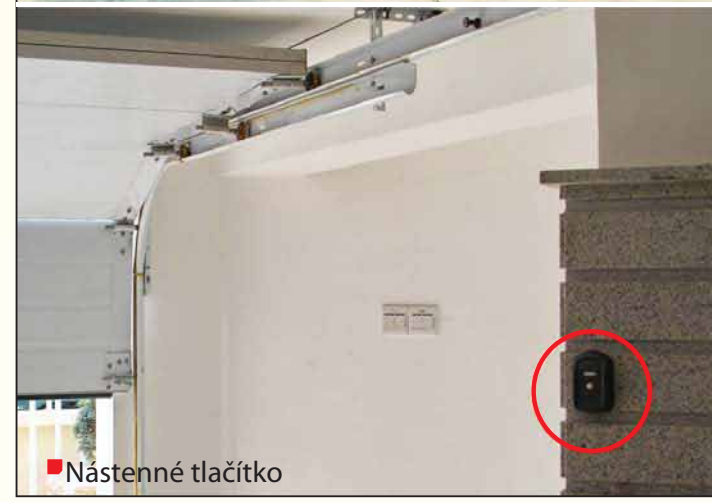
■ Nástenné tlačítko