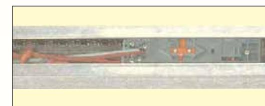
Patentovaná hriadeľová spojka, zabudovaná do kolajnice, ľahká obsluha