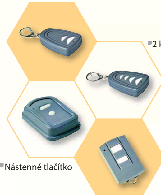
■ 2 kanálové