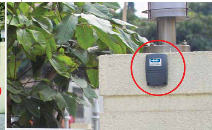
■ 2 alebo 4 kanálový vonkajší prijímač